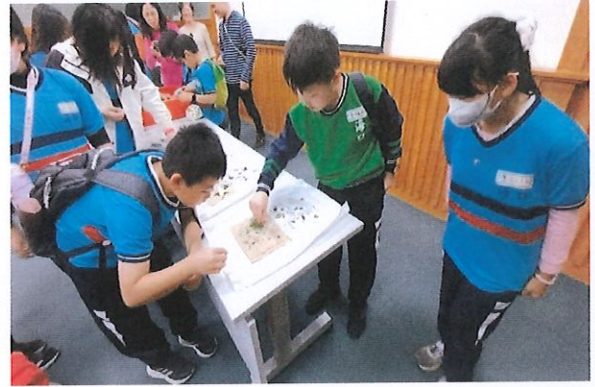
說明：學生們親身體驗「收蟻」