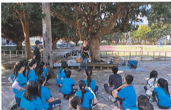
說明：老師教導學生攀樹技巧