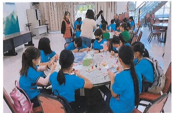
說明：蠶繭彩繪DIY創作活動