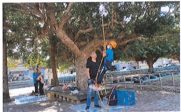
說明：利用繩結努力向上攀爬