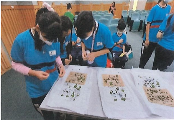
說明：學生們仔細觀察小小的「蟻蠱」