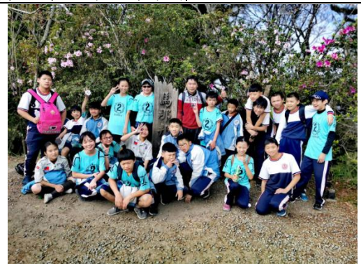
108 學年 1. 「南湖國中原住民文化踏查—我是部落裡的神箭手」。2. 「南湖國中生態樂活假期—暖溫帶森林的野性呼喚」--共 4 日課程，教育部 108 年戶外教育計畫自主學習課程。因新冠肺炎疫情，預計延後至 109 年暑假辦理。