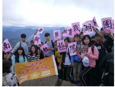
106 年”迎著凜冽季風之山海旋律—噶瑪蘭庶民樂曲採集工作隊”—6 日課程，教育部戶外教育計畫優質課程方案