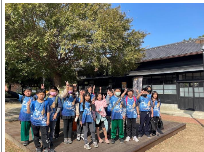
參觀山腳日式宿舍