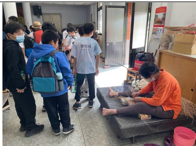
參訪阿婆編織蘭草