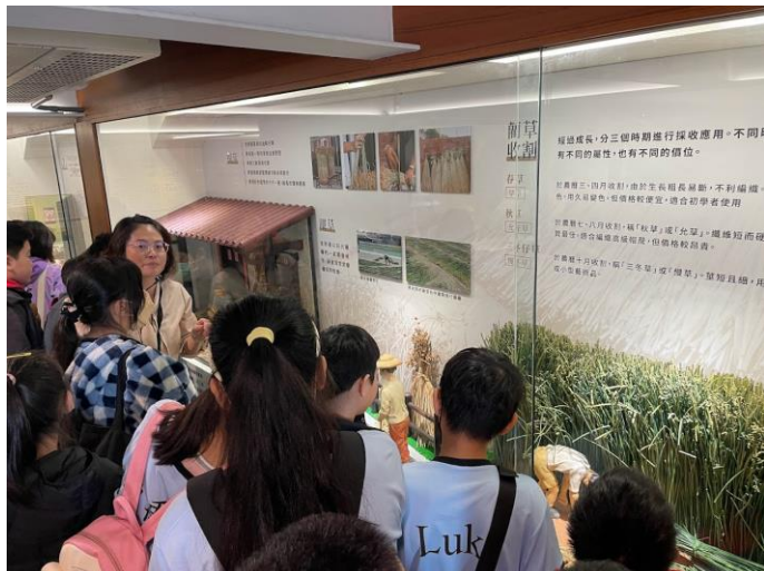
蘭草種植歷史介紹