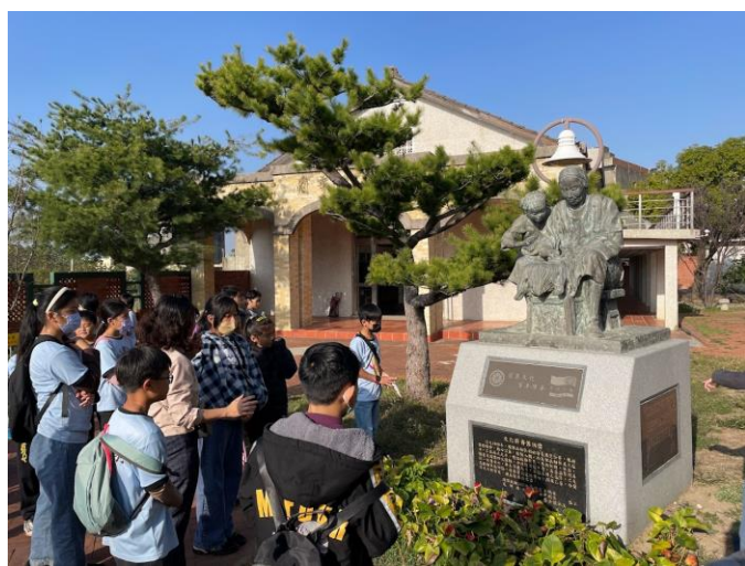
蘭草文化館導覽解說