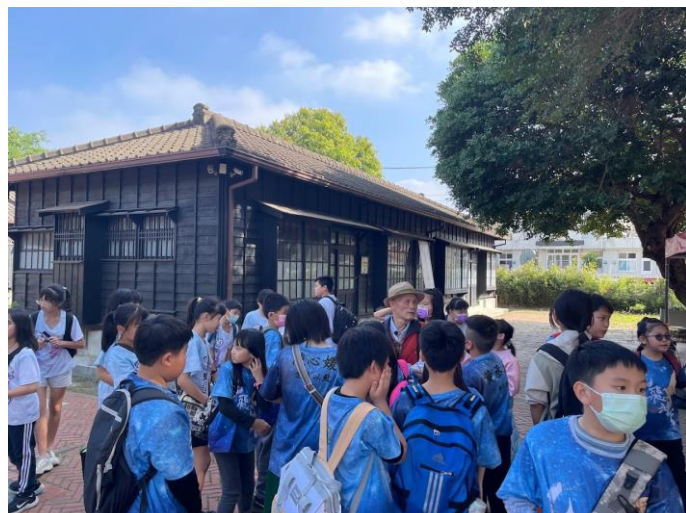
參觀山腳日式宿舍