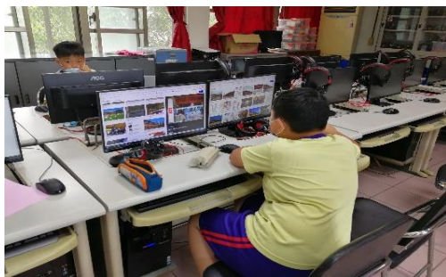
學生上網蒐集資料