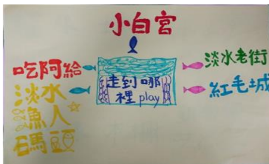
共同討論繪製出心智圖