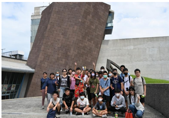
說明：十三行博物館參訪-團體合影