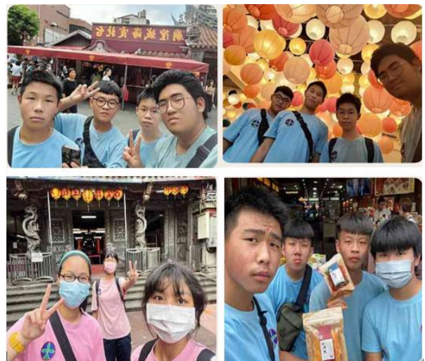
說明：大稻埕尋旅—學生分站活動