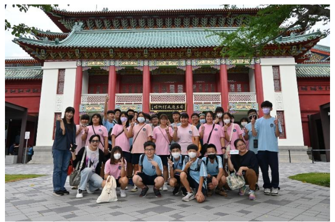
說明：國立歷史博物館參訪-團體合影