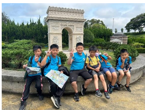
說明：認識家鄉與世界各國不同時期的建築型態