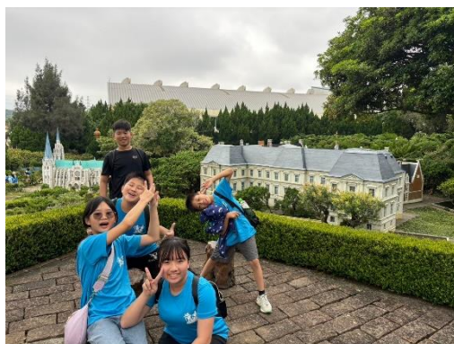
說明：知道各種景點的特色並查覺各種建築的特徵