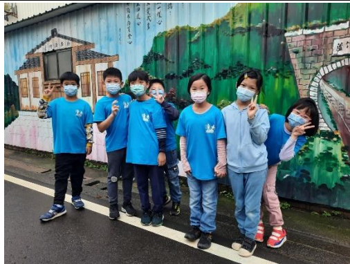
說明：蘆竹浦尋寶去