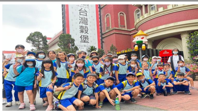
照片說明：抵達台灣穀堡-三年級全體合照