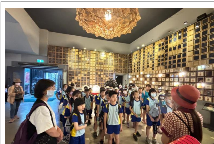
照片說明:台灣穀堡導覽(認識各國的米)