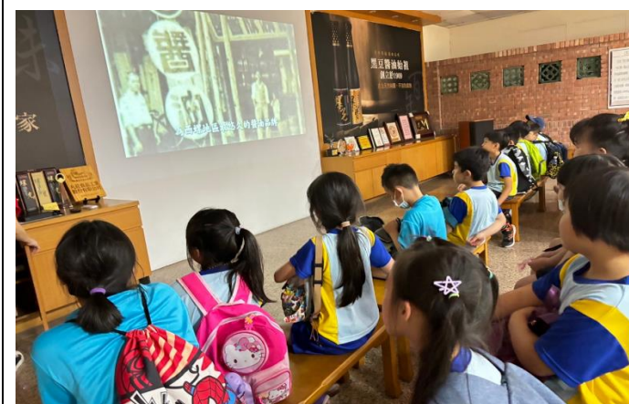
照片說明:丸莊醬油觀光工廠影片導覽