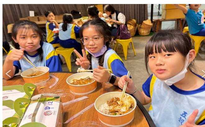
照片說明:享用美味的午餐