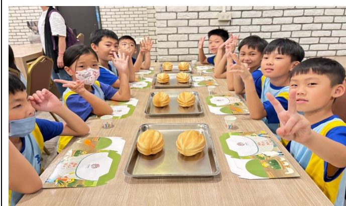
照片說明:米香 DIY-刺蝟造型惹人愛