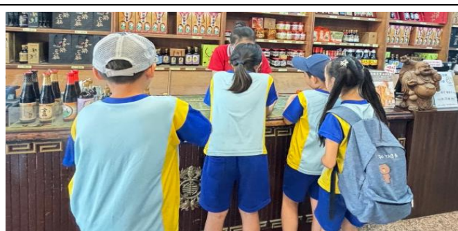
照片說明:學生採買豆製品,支持在地產業