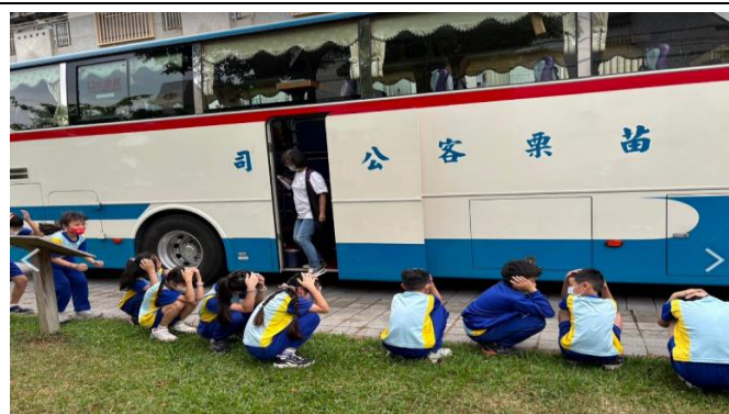
照片說明：行前逃生演練