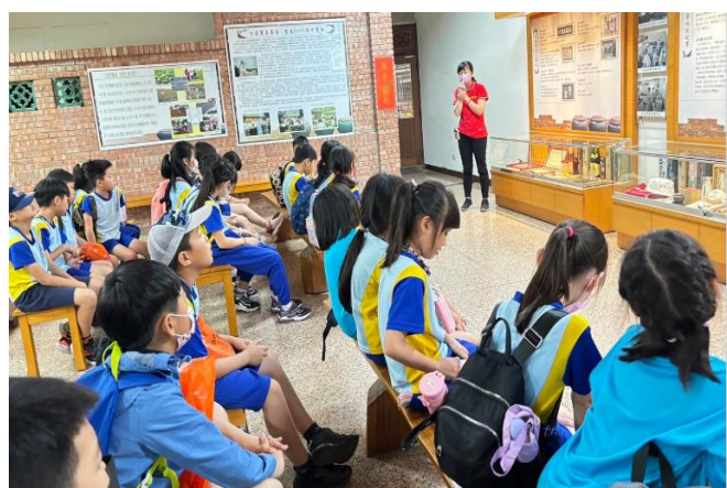
照片說明:認識醬油的製作與原料