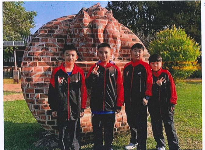
說明：山腳社區巡禮