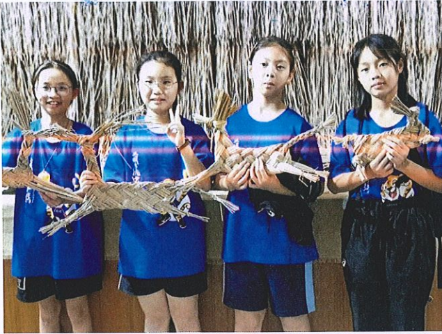
說明：參觀蘭草文化館