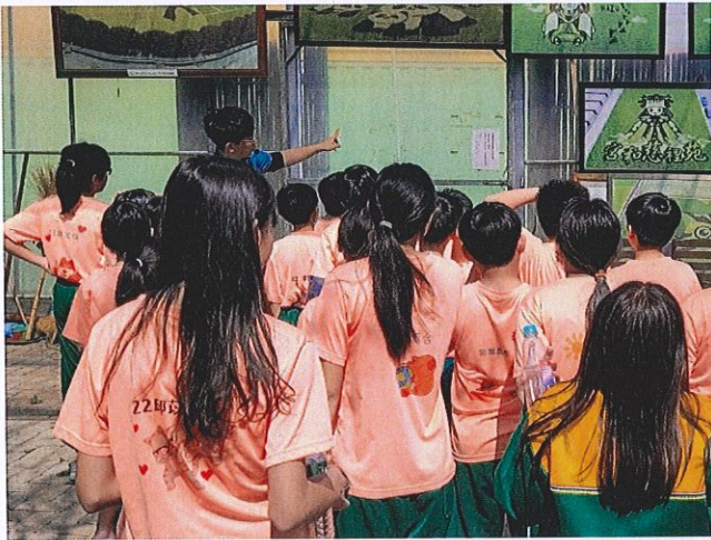
說明：認識苑裡米彩繪稻田