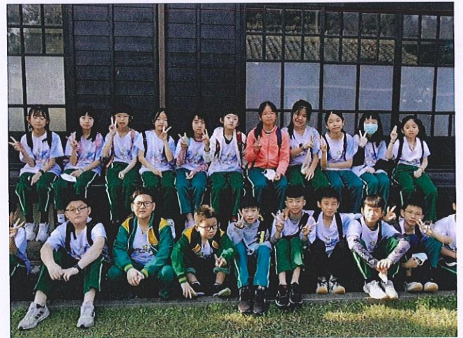
說明：走訪山腳日式宿舍