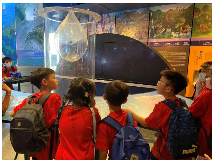
參觀海洋科學展覽