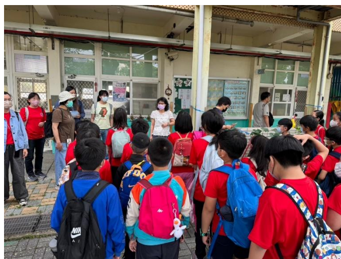
出發前校長再次提醒注意事項