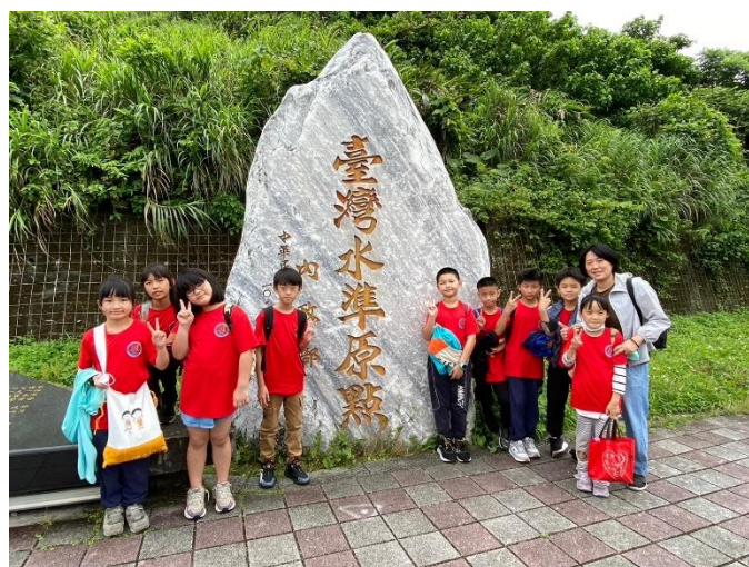
參訪臺灣水準原點