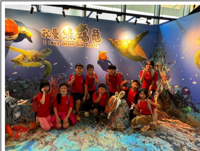
參觀海洋生態展覽