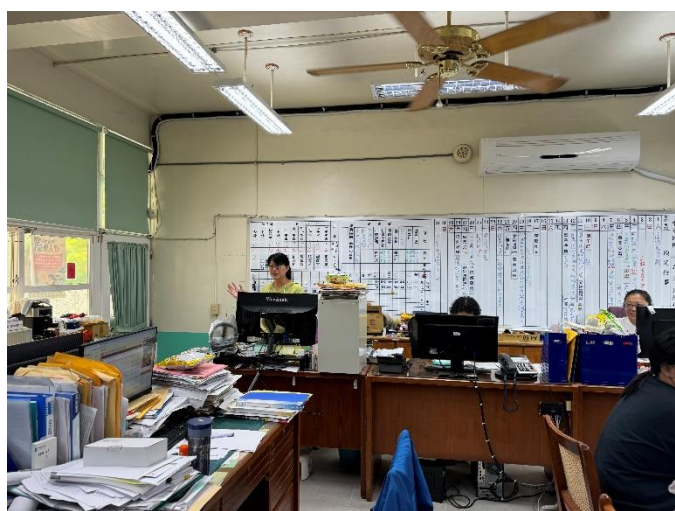
校務會議主任說明本次活動目標及地點