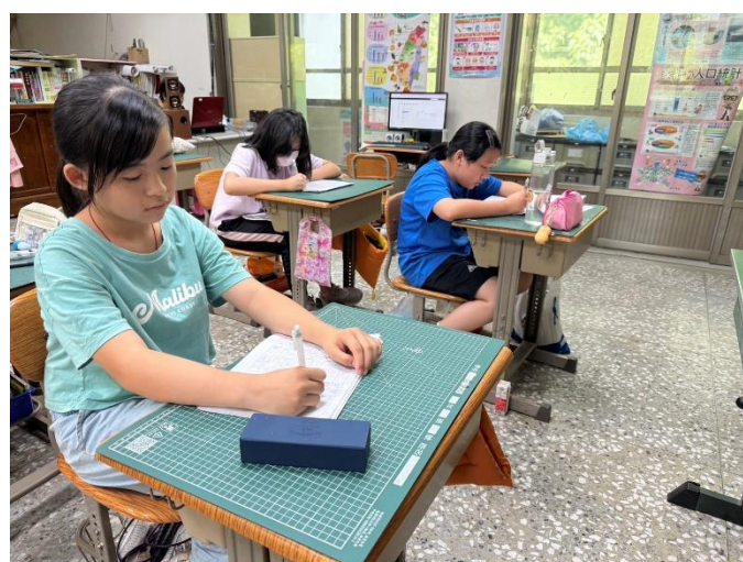
海洋科學導覽回到學校完成學習單

簡影們官看經鋪的如一譚教成室最 流介模到特得保的樓底學為一有 是口型了陳殊出養的仕下我印 什導多北的來很跡上問最我 麼覽覽台之四樣久，看間，象 ？覽覽島外子般了，發我 和？覽覽主，也船了，驚 台跟有，，是已，然，訝 灣我們著台，，是已，然，訝 的介的，，是已，然，訝 水我們，，是已，然，訝 文介的，，是已，然，訝 有紹的，，是已，然，訝 了便氣灣投 了便氣灣投