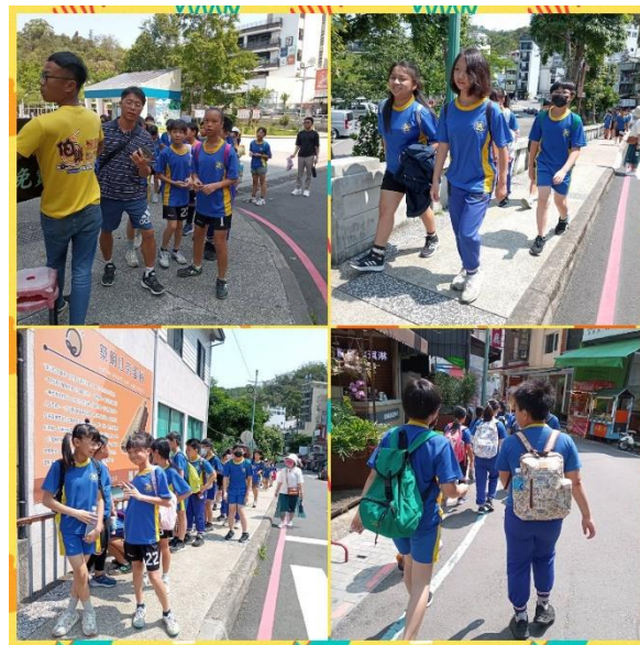
水沙連在地踏查巡禮