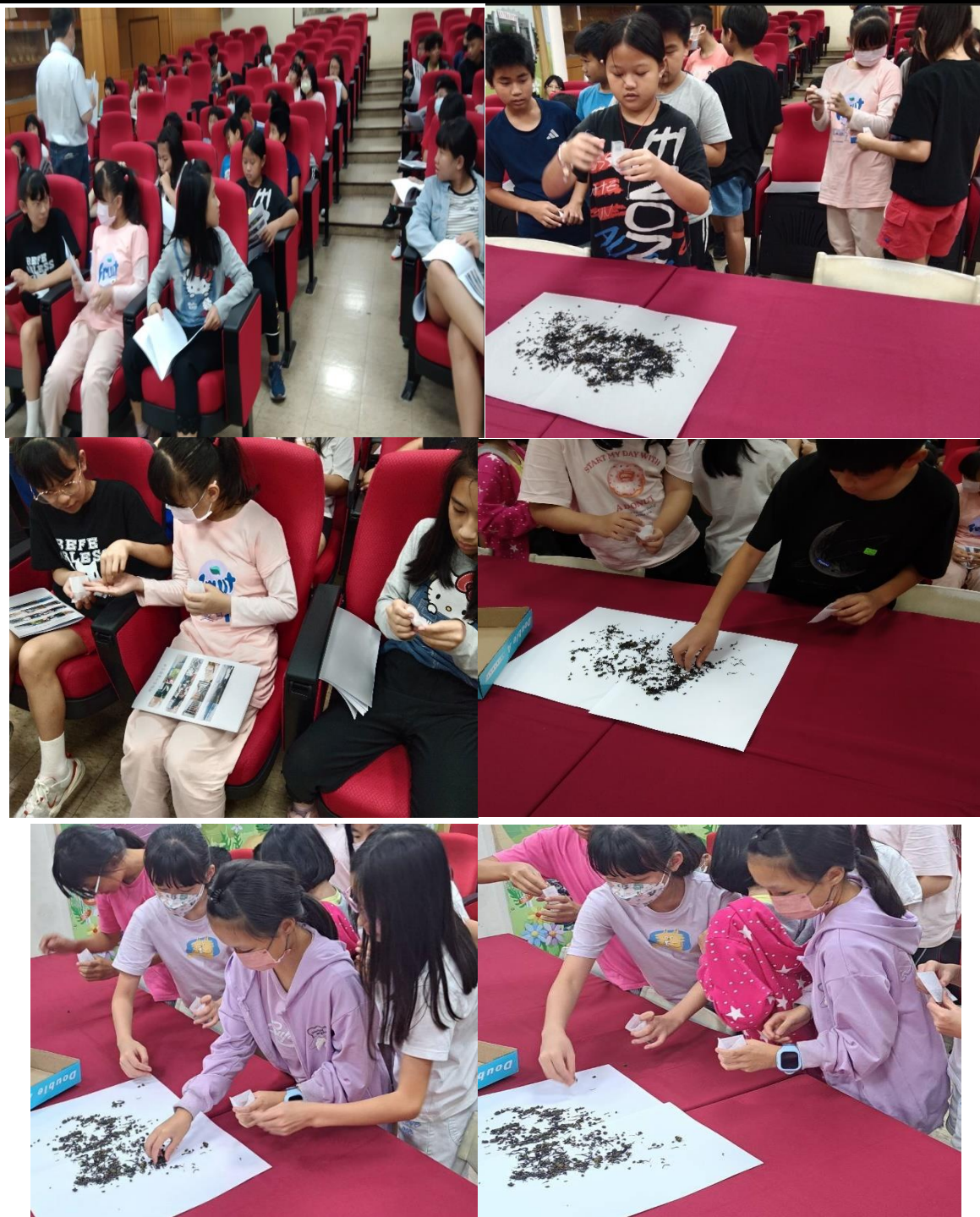
教師引導學生進行學習單與茶葉分辨體驗學習