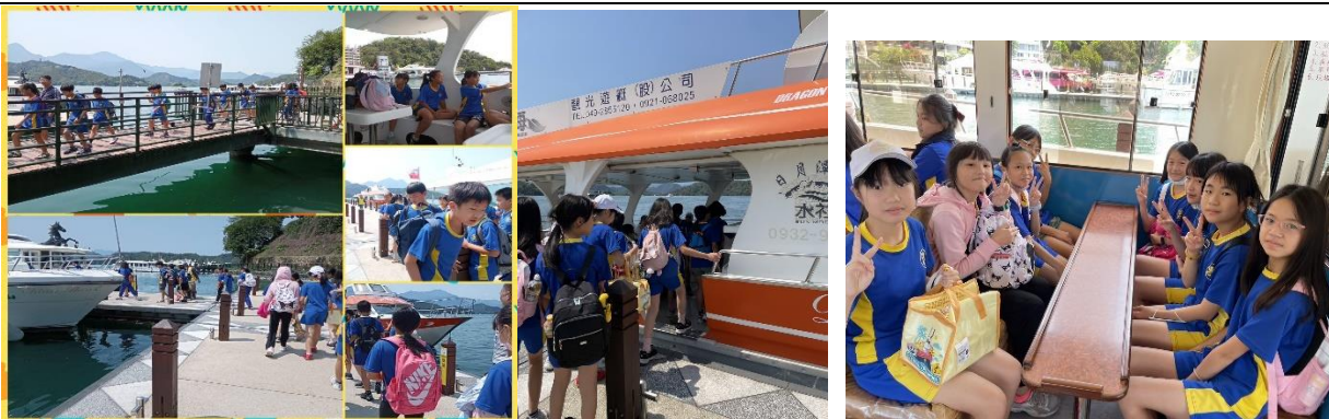
搭乘遊湖船一探水沙連