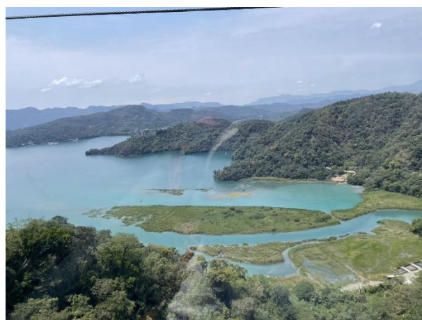
搭乘纜車鳥瞰日月潭風光