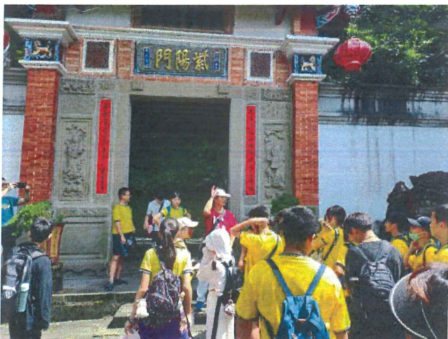
說明：紫陽門建築風格簡介