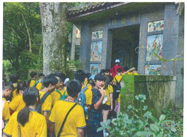
說明：獅頭山道德門旁九丁榕老樹