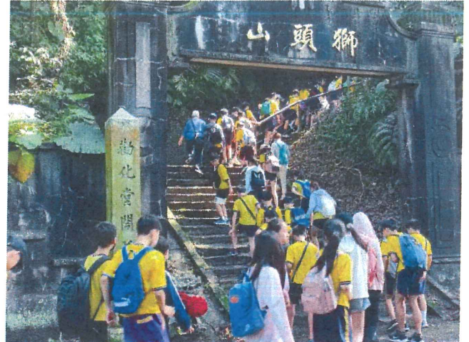
說明：獅山古道入口