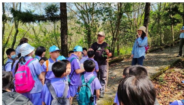
導覽員解說林場植物生態