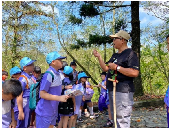
導覽員解說林場植物生態