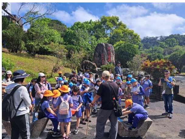
東勢林場歷史緣由介紹