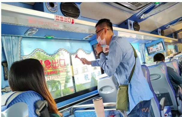
出發前進行遊覽車安全宣導