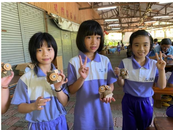
耶！完成了可愛的筆筒。