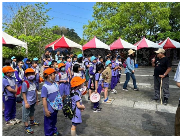
林場導覽員自我介紹與導覽前說明