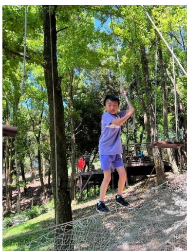
考驗體力與膽識的山訓體能訓練場