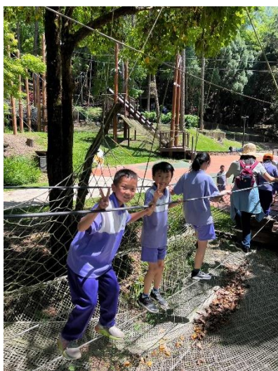
考驗體力與膽識的山訓體能訓練場