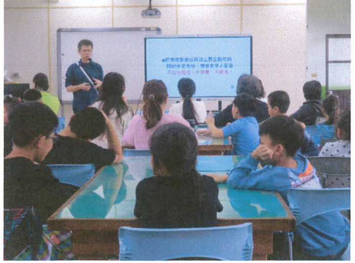
說明：講師說明野狗對淺山動物的威脅