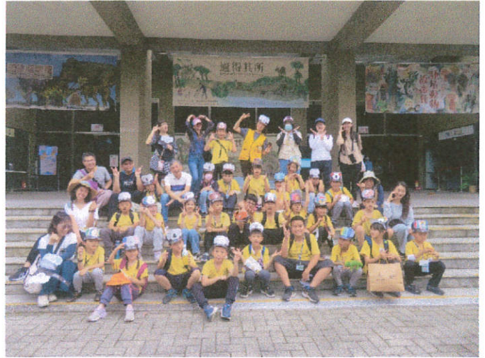
說明：戴上自己彩繪的無尾熊造型帽合照