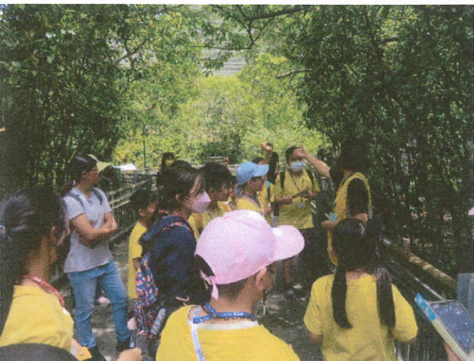
說明：導覽教師進行有獎徵答