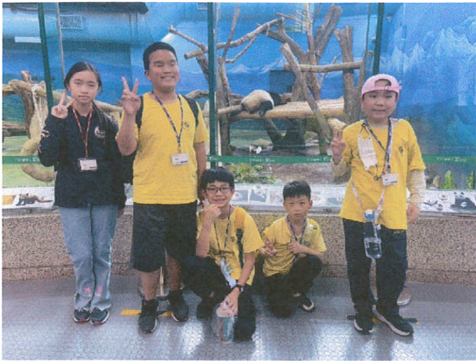
說明：跟動物明星大貓熊合影