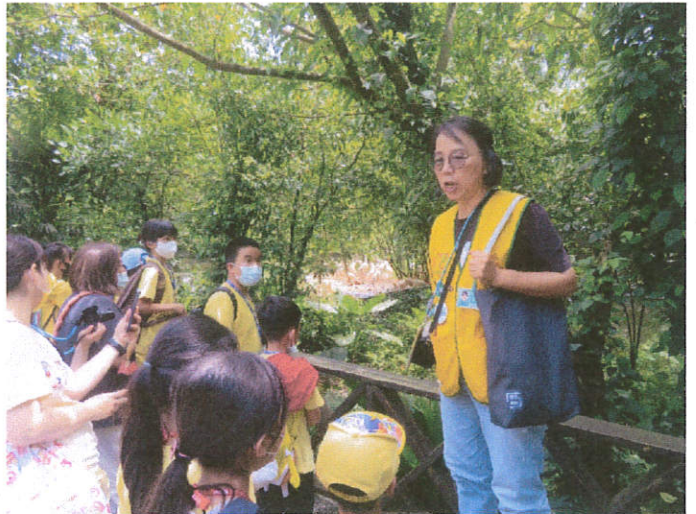
說明：導覽教師解說鳥園內的各種鳥類