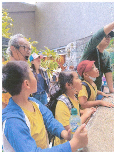
說明：導覽教師解說爬蟲動物的習性