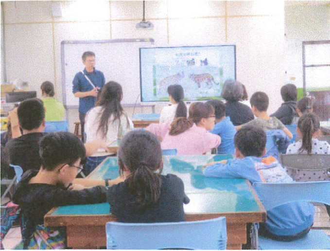
說明：講師說明家鄉常見的淺山動物