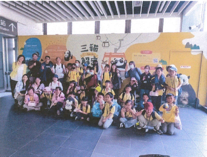
說明：開心搭乘貓纜往動物園出發