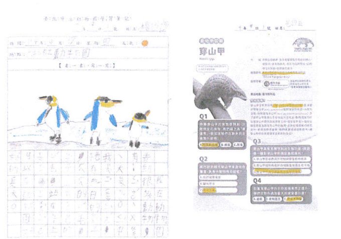
說明：中低年級學習單