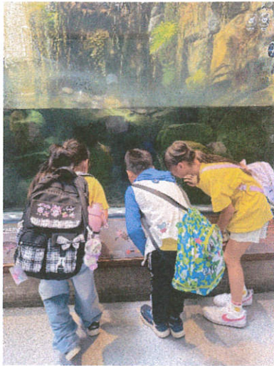
說明：仔細閱讀展板上的圖文說明