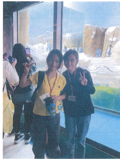
說明：國王企鵝排排站真可愛