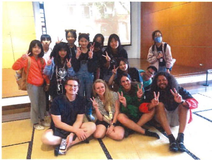
說明：和外國來的旅客聊天合照