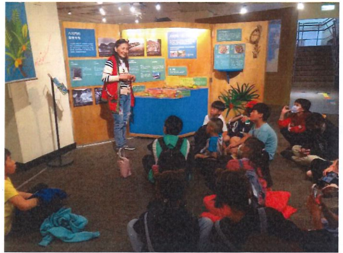
說明：凱達格蘭文化館導覽