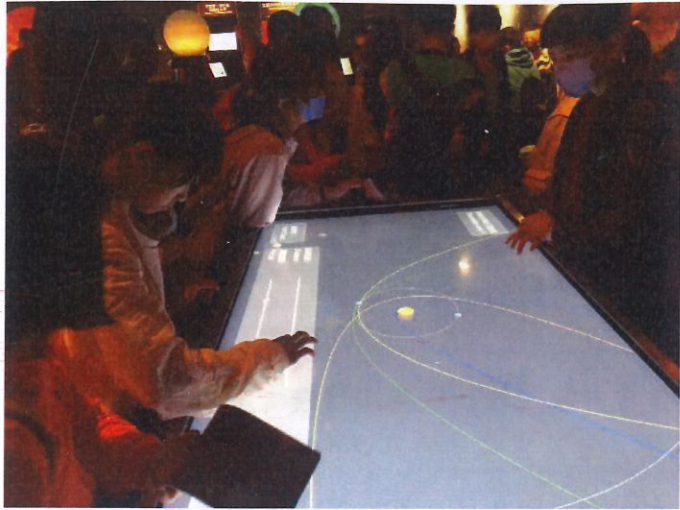
說明：天文館動手操作