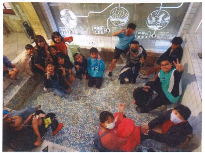
說明：溫泉博物館泡湯體驗