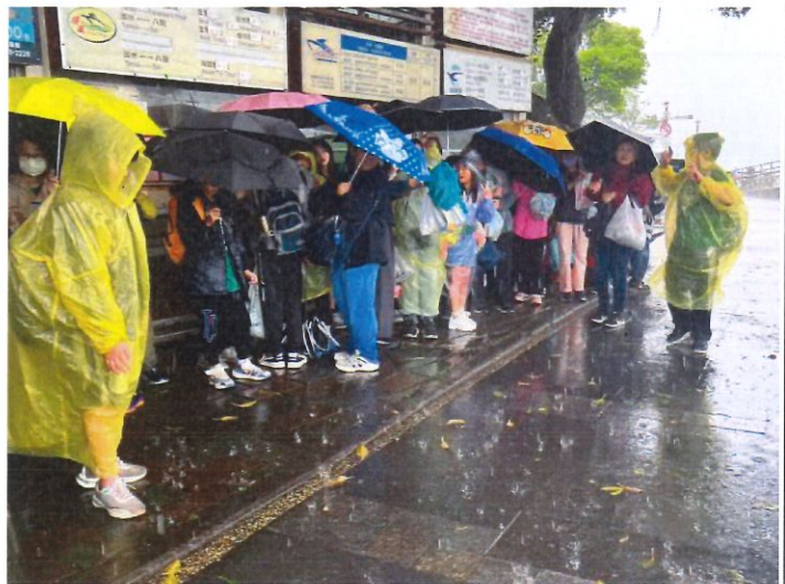
說明：風雨中等搭去八里的渡輪體驗